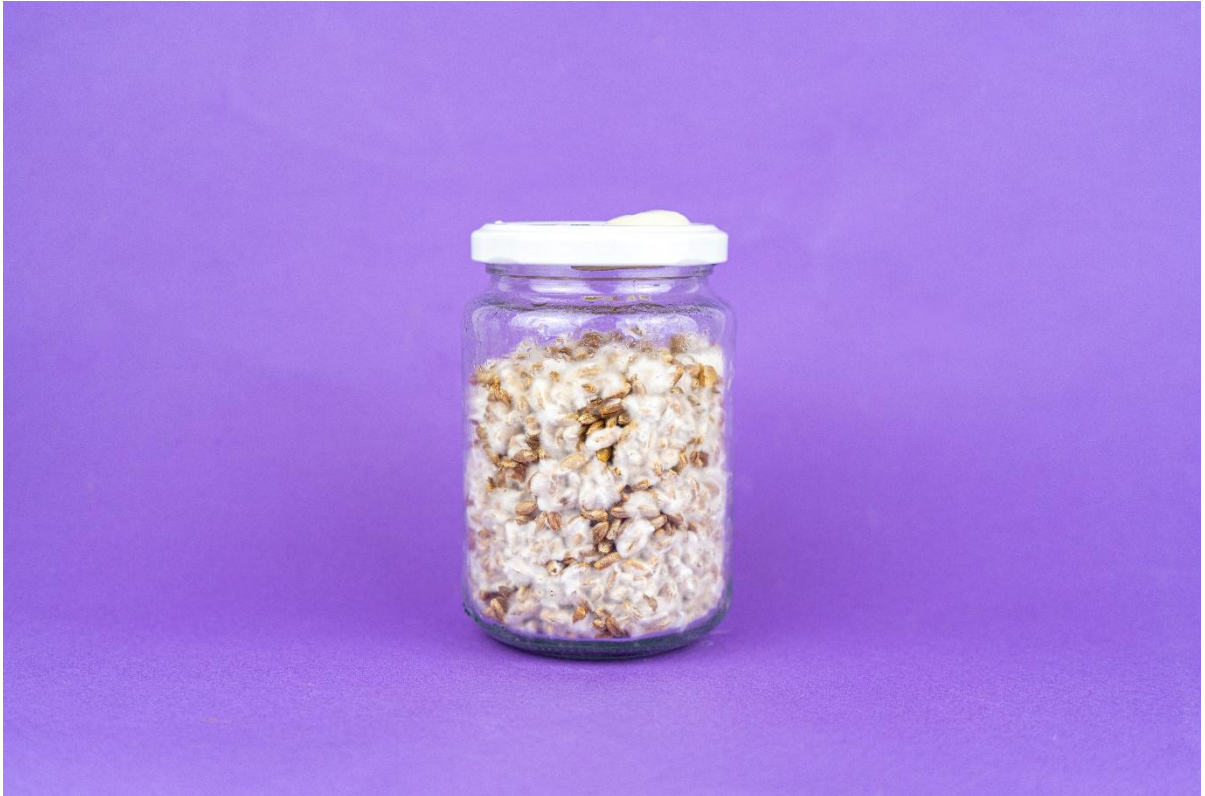
La foto de arriba muestra aproximadamente el crecimiento después de 2 semanas.