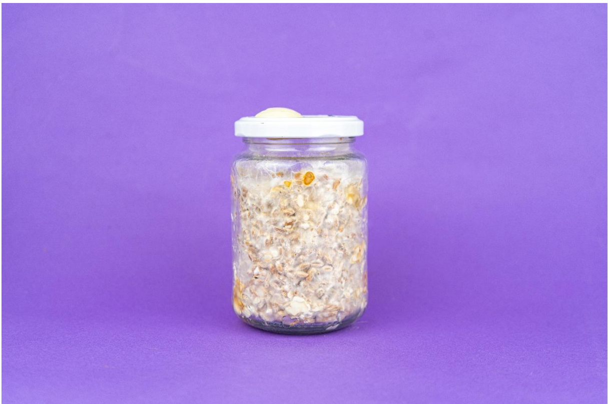
La foto de arriba muestra un frasco después de aproximadamente 3 semanas de crecimiento.